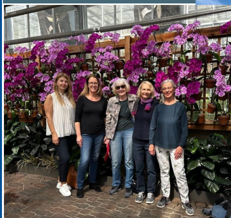
Atlanta Botanical Garden